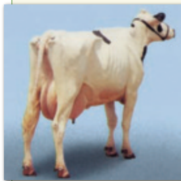
Figura 2. Calificación de la condición corporal.

Durante las primeras 4-6 semanas posparto, el consumo de alimento de la vaca no aumenta tan rápido como la producción de leche, lo que resulta en la movilización de las reservas corporales. Por lo tanto, durante los primeros dos meses de lactación, el grado de pérdida de condición BCS de una vaca es determinado por el balance entre su capacidad de captación de nutrientes y su potencial genético para producción. De acuerdo con el NRC (2001), para una vaca alimentada de forma adecuada, el equilibrio entre la movilización de tejidos y su depó-